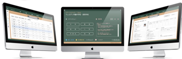
私立小中高向けトータル校務システム スクールマスターZeus