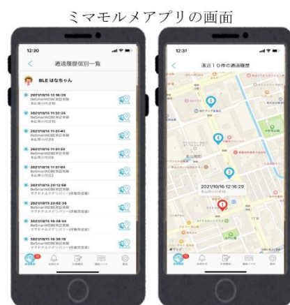
ミマモルメアプリの画面

直近10件の履歴が通過順に地図上(※)でマッピング表示されます。 ※端末によりApple Maps又はGoogle Maps(上記画像はApple Mapsの例)