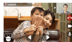
ビデオチャットロボット遠隔操作イメージ

また、新型コロナウイルスにより制限が設けられ面会が難しくなった高齢者施設に入所されているご高齢のご家族の面会や、お一人でお住まいのご家族と、離れている場所でも一緒にお食事や会話を楽しむことが可能です。